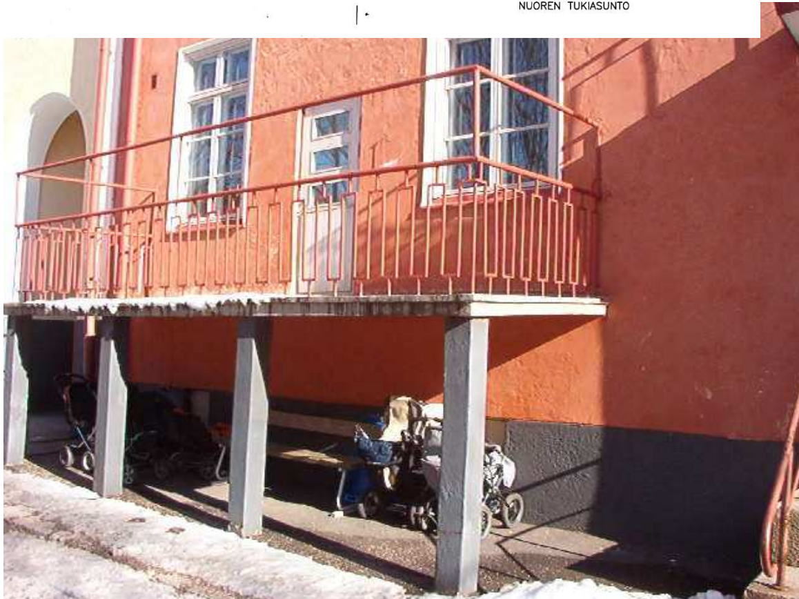
PÄIVÄKODIN RAKENTAMISEN YHTEYDESSÄ TOTEUTETTU PARVEKE, TUKIPERHEEN ASUNNON PARVEKE