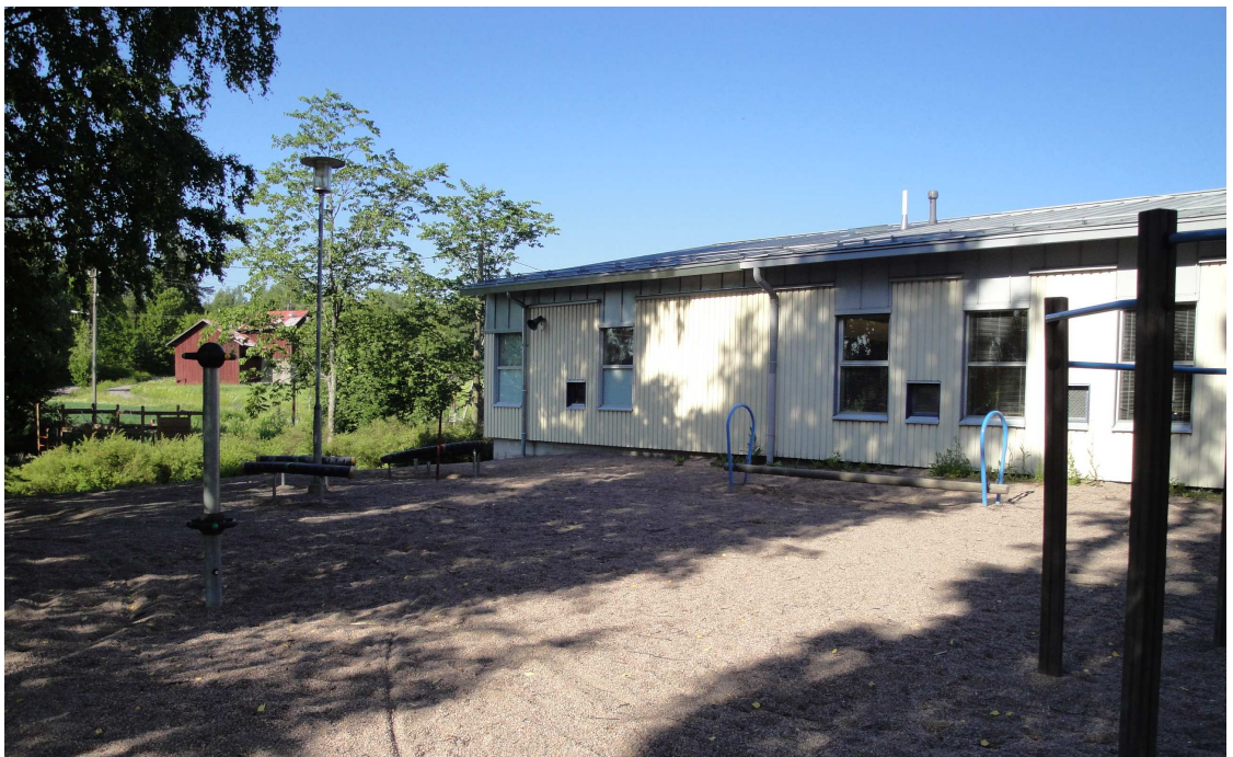
KUVA KOULUN PIHA-ALUEELTA

Olemassa oleva koulurakennus 1804 m 2 , laajennus 599 m 2 .