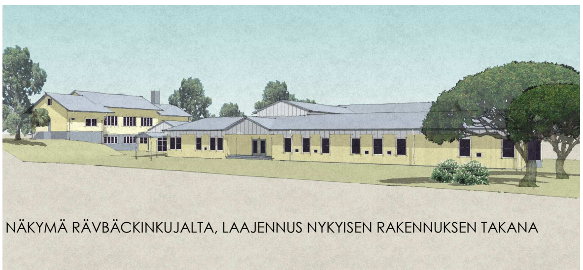
NÄKYMÄ RÄVBÄCKINKUJALTA, LAAJENNUS NYKYISEN RAKENNUKSEN TAKANA

Nykyinen koulurakennus koostuu useassa vaiheessa rakennetuista osista. Vanha kivirakenteinen koulu sai 1980-luvulla laajennuksen ns. parakkikoulusta. 2000-luvun alussa tasakattoiset parakit peruskorjattiin ja varustettiin harjakatolla. Samalla yhdistettiin erilliset koulurakennukset sisäyhteydellä.